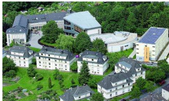
Stand: Juli 2019 / Änderungen vorbehalten